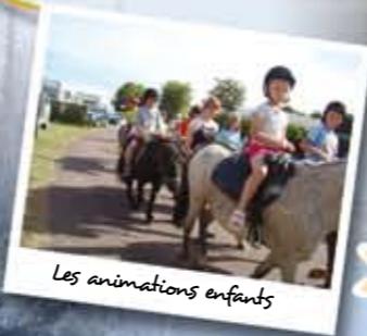
Les animations enfants