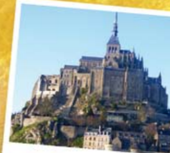
Le Mont Saint-Michel