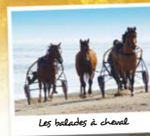
Les balades à cheval