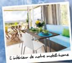
L'intérieur de notre mobil-home

Venez profiter d'un séjour au Point du Jour, garant d'une ambiance conviviale et familiale, en cottage tout confort, originale en hébergement insolite ou authentique sur des emplacements caravanning privilégiés. Au pied d'espaces naturels protégés, des plages du débarquement, de chemins de randonnée, d'activités nautiques ou farniente sur nos grandes plages de sable fin, la Côte Fleurie et Le Point du Jour vous accueillent pour des moments de détente inoubliables.