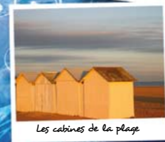
Les cabines de la plage